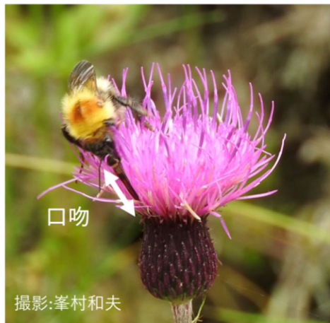
(a) ナガマルハナバチ